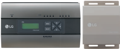
PQNUD1S40 (Premium, 8 portów) PPWRDB000 (Standard, 2 porty)

Moduł PDI umożliwia monitoring zużycia energii elektrycznej dla maksymalnie 128 jednostek wewnętrznych